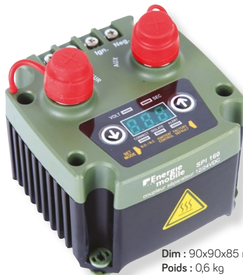
Dim : 90x90x85 mm Poids : 0,6 kg