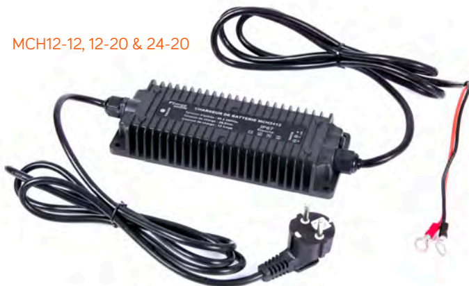
Livrés avec câbles DC & AC de 1,2M cosses oeillets M8 et prise 230V