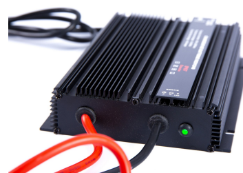
MCH12-40 & 24-20